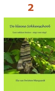
De kleine sokkenschool Ela van Swieten-Marquandt