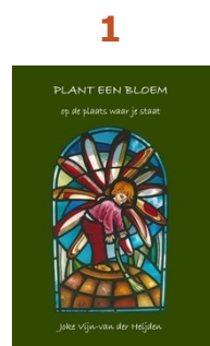
Plant een bloem Joke Vijn-van der Heijden