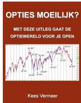
Opties moeilijk? Kees Vermeer