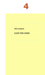
Elegy for a Rose Dirk Lenaerts